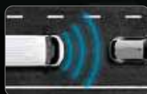
ADAPTIVE CRUISE CONTROL*