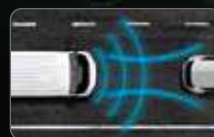
TRAFFIC JAM ASSIST*