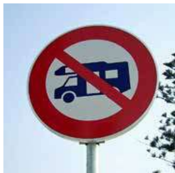
Le panneau dénommé B6a1 est illégal lorsqu'il comporte en son centre un pictogramme « camping-car ».

Dans les communes très touristiques, il s'agit souvent d'un savant mélange de tous ces motifs. C'est d'ailleurs étonnant sur le plan économique tant les propriétaires de camping-cars sont consommateurs de produits locaux, se rendent dans les commerces et profitent des restaurants, comme le démontre certaines études dont nous avons connaissance. C'est sans doute pour cette raison que le juge a développé dans sa jurisprudence une référence à la théorie du bilan coût - avantages : si les inconvénients d'une réglementation sont excessifs par rapport aux avantages retirés par la commune, elle doit en principe être annulée.